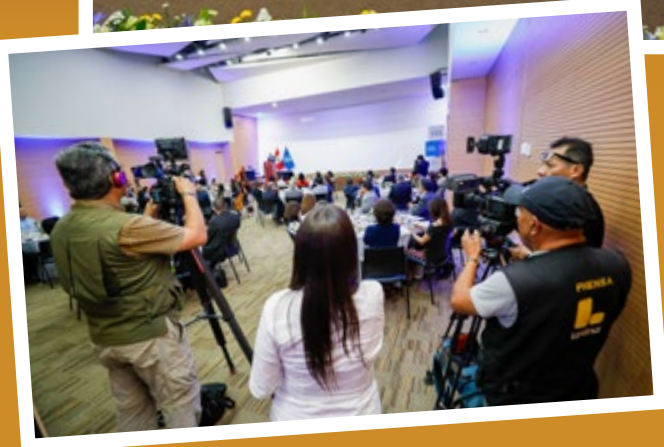
Alta convocatoria de periodistas tuvo el premio Ramón Remolina.