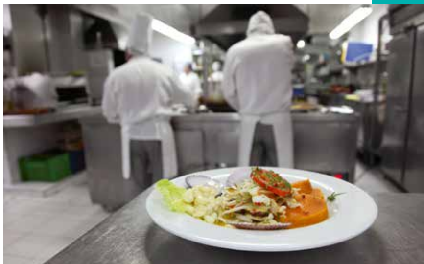
Restaurantes marinos. Se busca fomentar el consumo en estos negocios en horario nocturno, para ayudarlos en sus ventas, señala el sector de gastronomía de la CCL.

Pero, además, recomendó que este tipo de restaurantes deben buscar ofrecer una carta más variada, que logre atraer a más clientes locales, y turistas del extranjero.