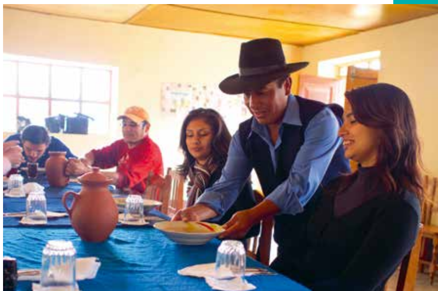
Verano. Esta temporada representa alrededor del 35% de comercialización anual de restaurantes, según AHORA.

“Estamos pasando momentos difíciles. El panorama se nota incierto porque hasta ahora no hay solución. Y hay especulación de precios con ciertos alimentos que han subido como el caso de las cebollas que vienen del sur del