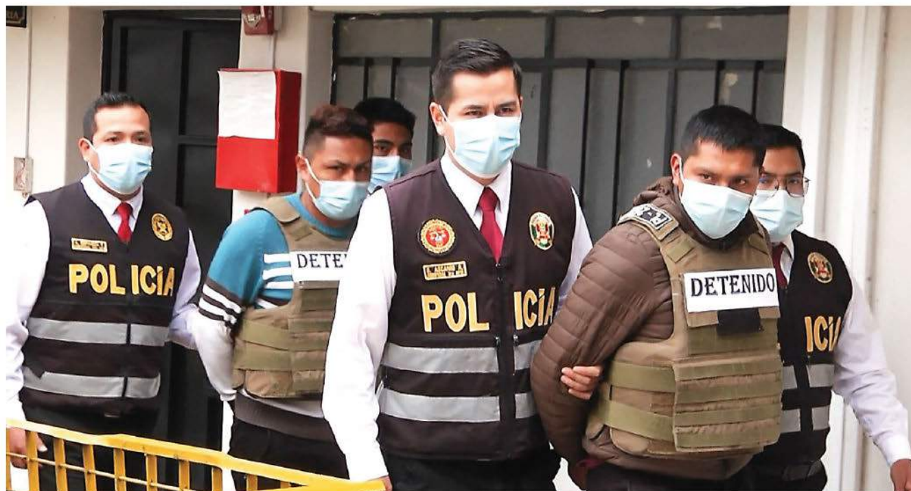
El evento virtual se llevó a cabo los días 25 y 26 de abril y fue transmitido vía Facebook Live y YouTube del gremio empresarial.