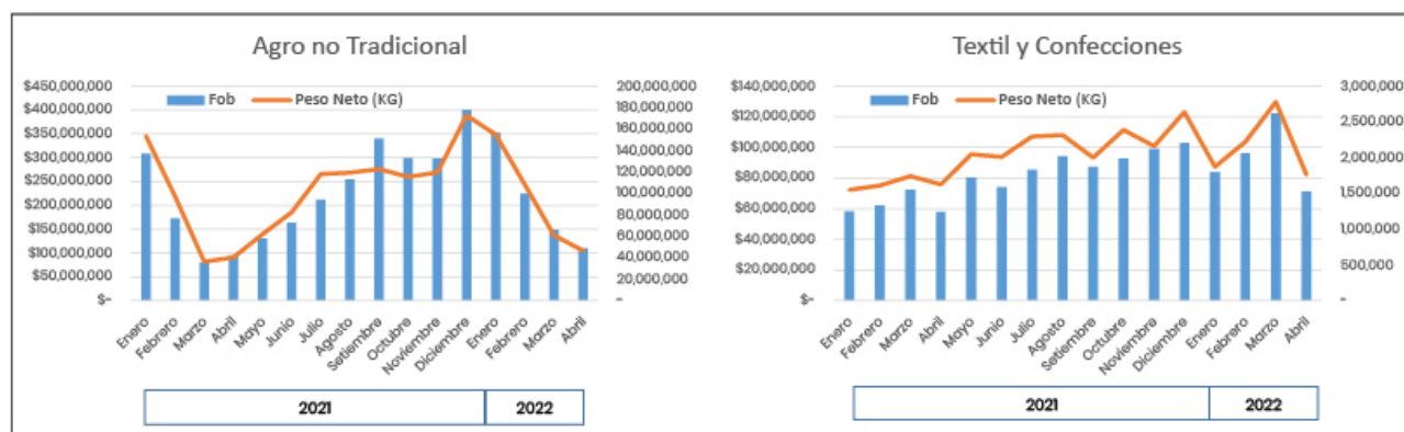
Gráfico 2. Exportaciones peruanas del sector agro no tradicional y textil y confecciones, valor FOB en US$ y peso neto en kilogramos

En cuanto al agro no tradicional, comparando los cuatro primeros meses del 2022 con similar periodo del 2021, observamos un incremento tanto en el valor como en el volumen exportado. Con respecto al sector textil y confecciones, en el 2022, los envíos hacia Estados Unidos muestran un crecimiento sostenido hasta el primer cuatrimestre, en comparación al 2021.