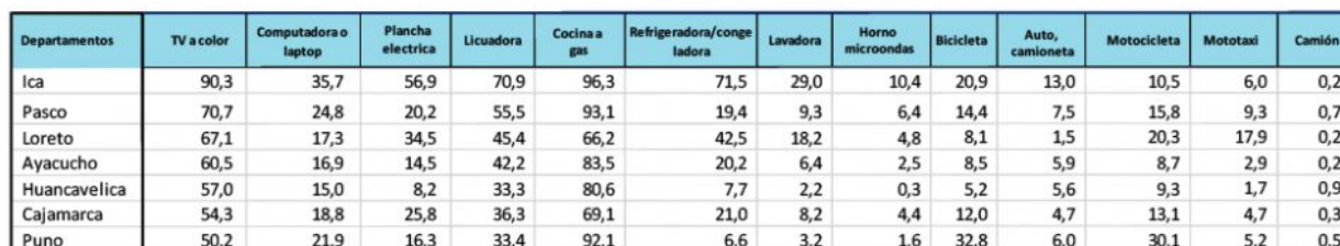
Porcentaje de la población regional que cuenta con activos duraderos 2021

liderazgo en camiones, mientras que Loreto hace lo propio con mototaxis. Como se observa, los activos en los que la población de Ica es superada por otras regiones se debe a que estos son empleados como una herramienta de trabajo.