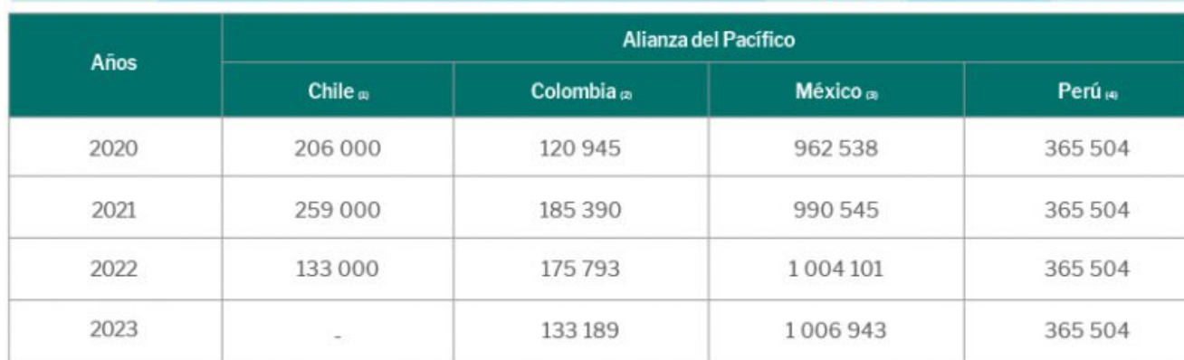
SALDO DE LAS INVERSIONES EXTRANJERAS DIRECTAS DE SINGAPUR EN LA ALIANZA DEL PACÍFICO (En miles de US$)

(1) Saldo de inversiones provenientes del continente asiático acumuladas desde 2012 al año en mención.