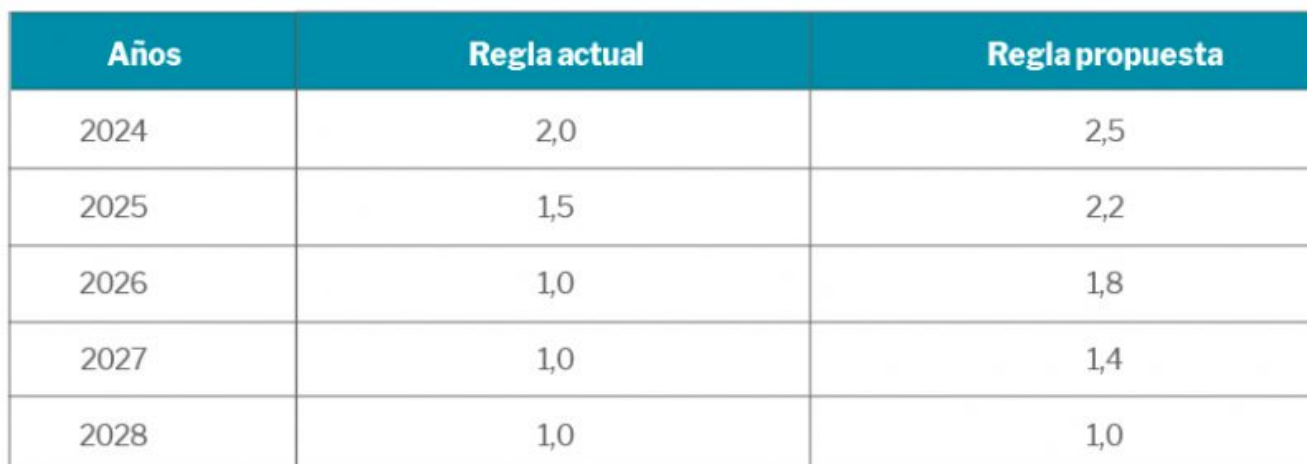
DÉFICIT FISCAL 2024-2028 (% del PBI)

Fuente: Marco Macroeconómico Multianual 2024-2027