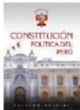
Constitución Política del Perú