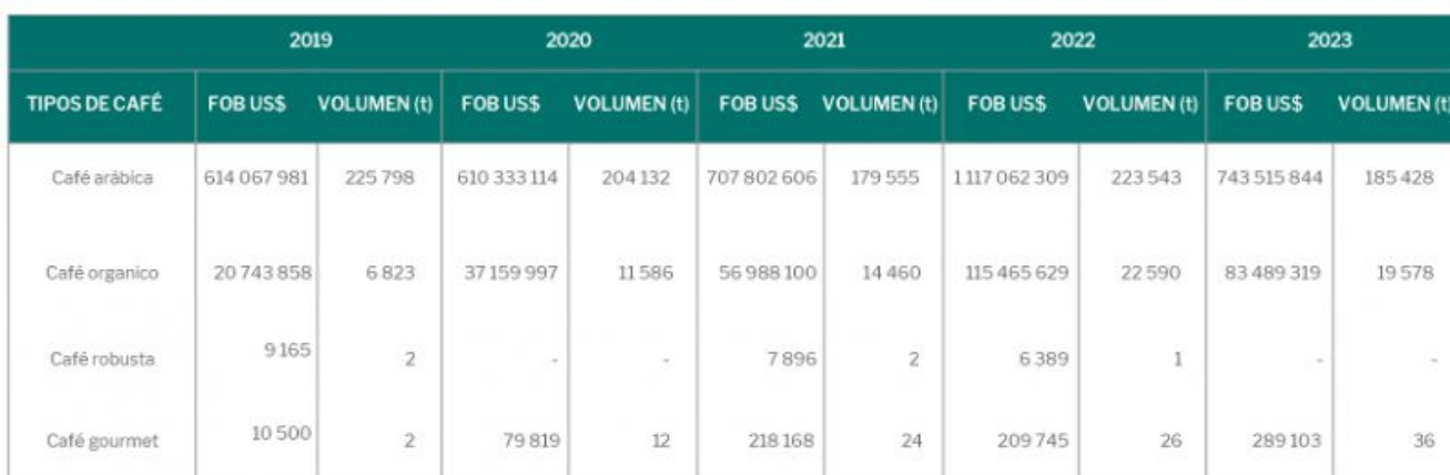
EXPORTACIONES PERUANAS POR TIPOS DE CAFÉ (2019 - 2023)

En el siguiente cuadro detallamos los tipos de café que el Perú exporta al mundo, según la base de la Superintendencia Nacional de Administración Tributaria y Aduanas ( Sunat ). Cabe señalar que estos resultados se basan en cómo los exportadores peruanos de café describen sus productos en las declaraciones respectivas ante aduanas .