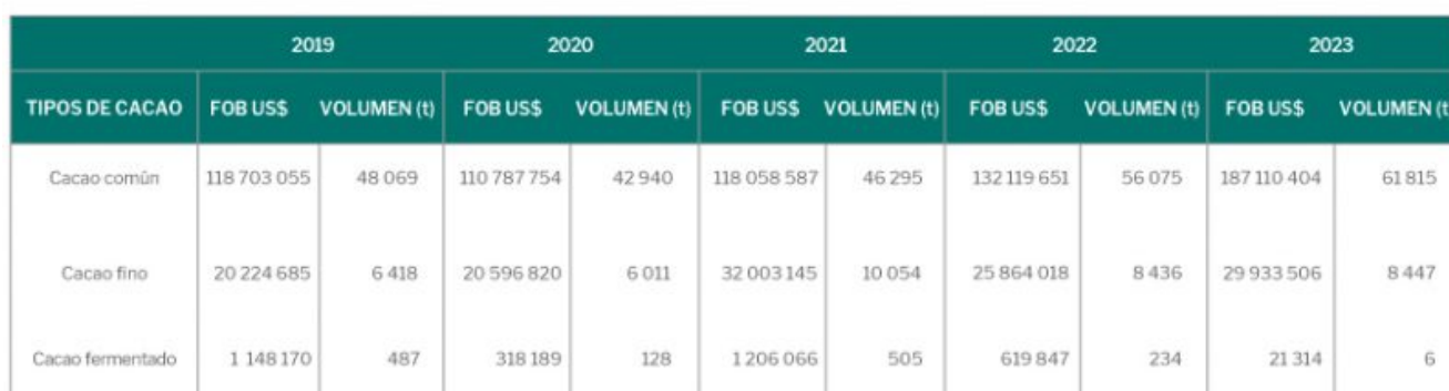
EXPORTACIONES PERUANAS POR TIPOS DE CACAO (2019 - 2023)

En el siguiente cuadro detallamos los tipos de cacao que el Perú exporta al mundo. Se debe tomar en cuenta de que estos resultados se basan en como los exportadores peruanos de cacao describen sus productos en las declaraciones respectivas ante la aduana.