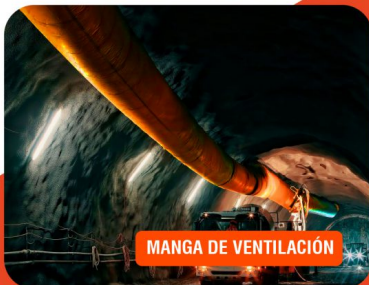
MANGA DE VENTILACIÓN