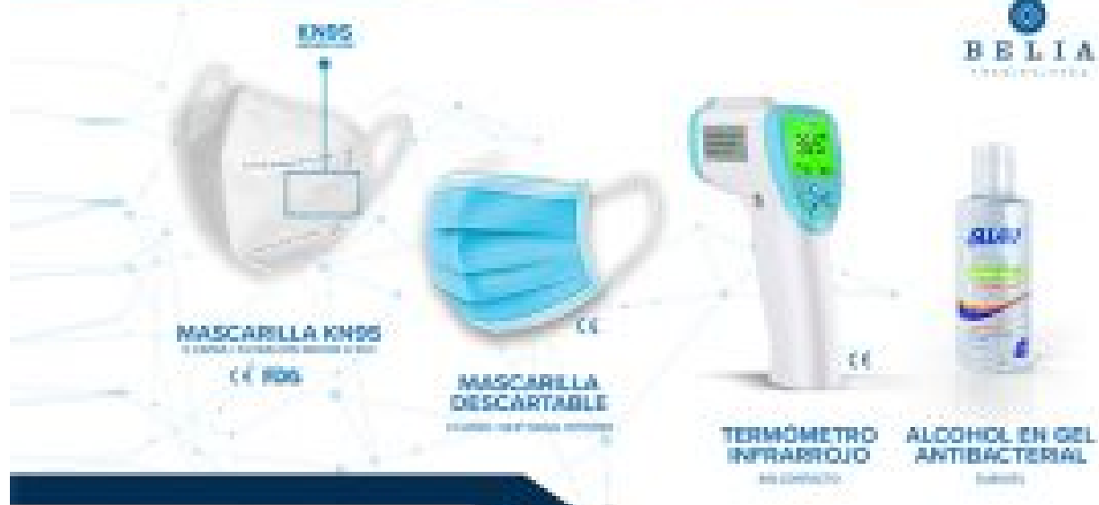
MASCARILLA KN95 EQUIVALENTES A N95 CE 006